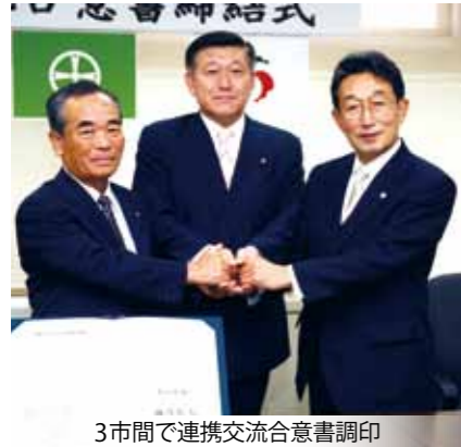
3市間で連携交流合意書調印