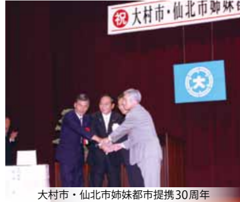
大村市・仙北市姉妹都市提携30周年