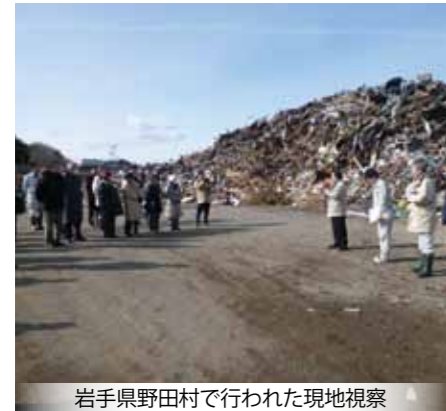
岩手県野田村で行われた現地視察