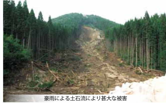
豪雨による土石流により甚大な被害