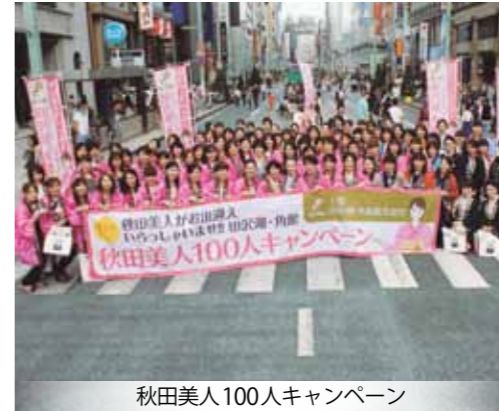
秋田美人100人キャンペーン