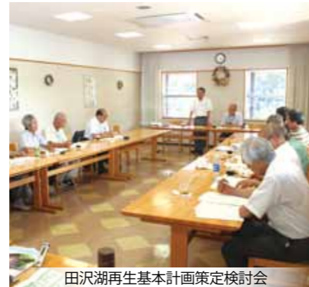
田沢湖再生基本計画策定検討会