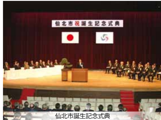
仙北市誕生記念式典