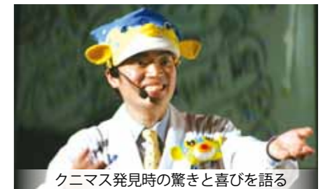
クニマス発見時の驚きと喜びを語る