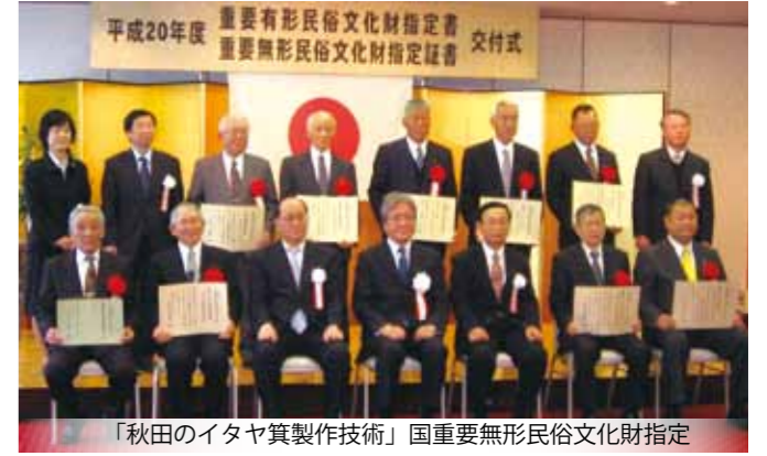
「秋田のイタヤ箕製作技術」国重要無形民俗文化財指定