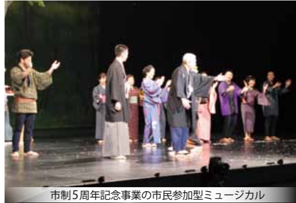
市制5周年記念事業の市民参加型ミュージカル