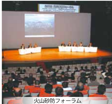
火山砂防フォーラム