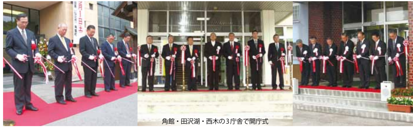
角館・田沢湖・西木の3庁舎で開庁式