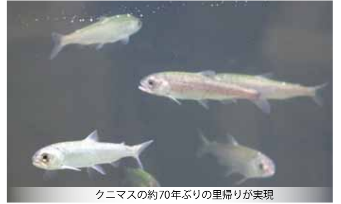
クニマスの約70年ぶりの里帰りが実現