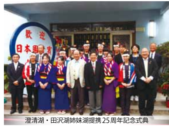
澄清湖・田沢湖姉妹湖提携25周年記念式典