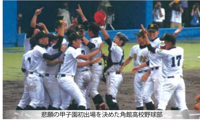
悲願の甲子園初出場を決めた角館高校野球部