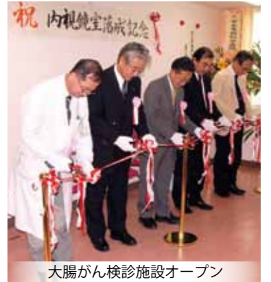
大腸がん検診施設オープン