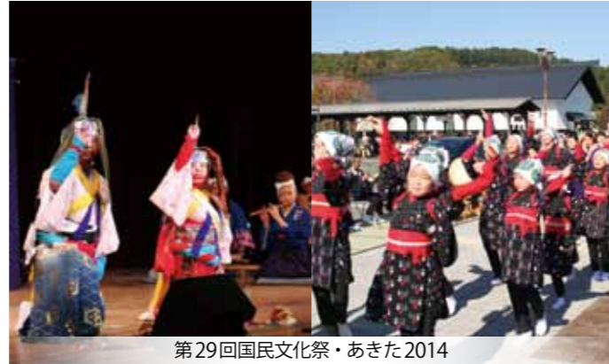
第29回国民文化祭・あきた2014