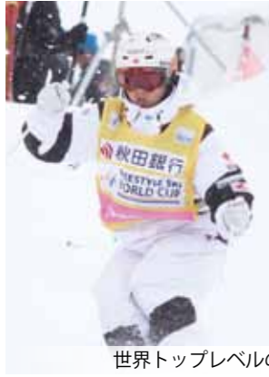
世界トップレベルのスキーヤーを前に大興奮