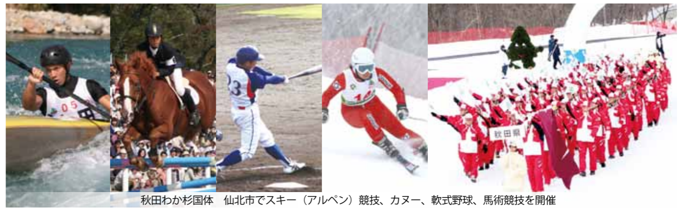
秋田わか杉国体 仙北市でスキー（アルペン）競技、カヌー、軟式野球、馬術競技を開催