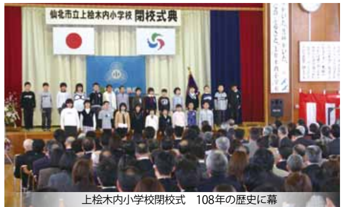
上楡木内小学校閉校式 108年の歴史に幕