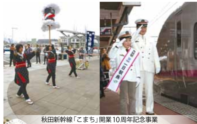
秋田新幹線「こまち」開業10周年記念事業