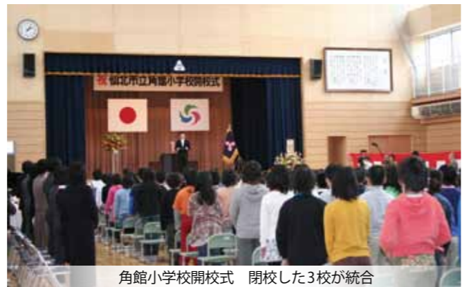
角館小学校閉校式 閉校した3校が統合