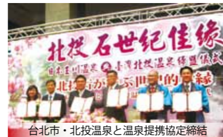
台北市・北投温泉と温泉提携協定締結

3月11日14時46分頃、三陸沖を震源とする最大震度7(マグニチュード9.0)の観測史上最大規模の地震が発生。仙北市でも震度4を観測したほか、大規模停電や通信障害など数日にわたり生活に影響を受けた。