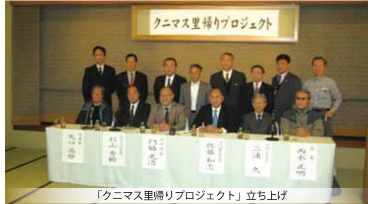
「クニマス里帰りプロジェクト」立ち上げ