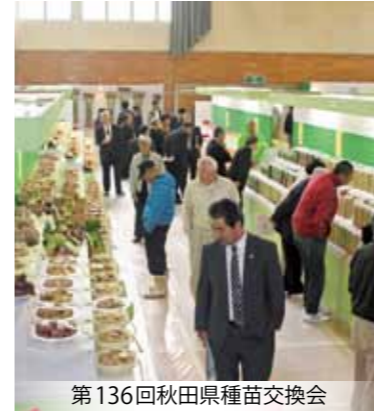
第136回秋田県種苗交換会