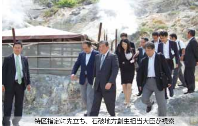
特区指定に先立ち、石破地方創生担当大臣が視察