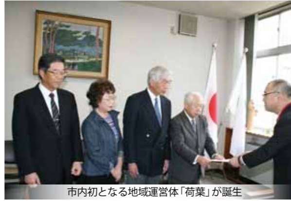
市内初となる地域運営体「荷葉」が誕生