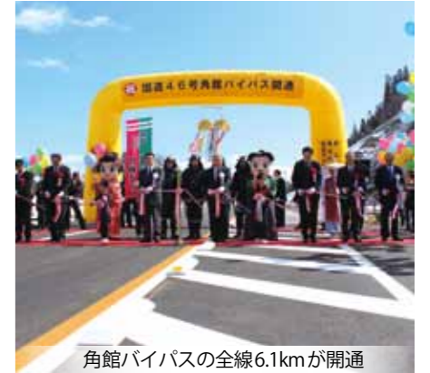
角館バイパスの全線6.1kmが開通