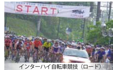
インターハイ自転車競技(ロード)