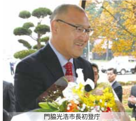
門脇光浩市長初登庁