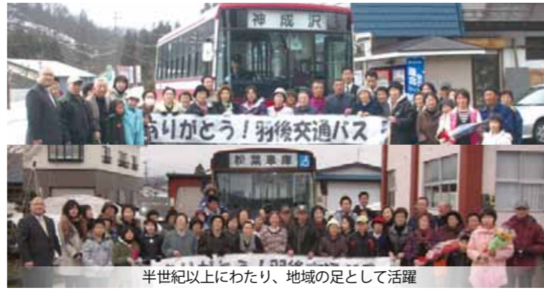
半世紀以上にわたり、地域の足として活躍