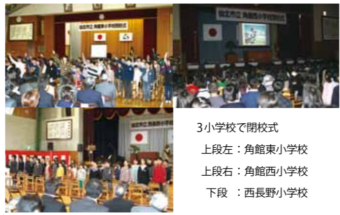
3小学校で閉校式 上段左：角館東小学校 上段右：角館西小学校 下段：西長野小学校