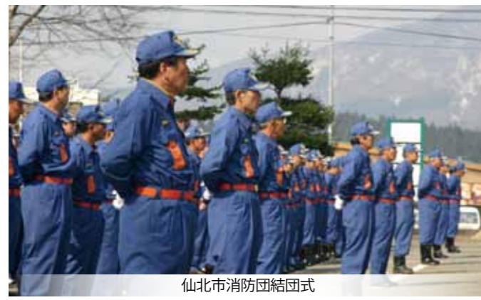
仙北市消防団結団式