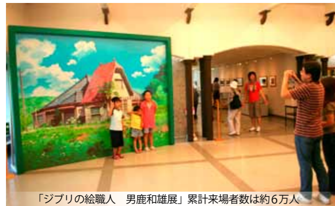
「ジブリの絵職人 男鹿和雄展」累計来場者数は約6万人