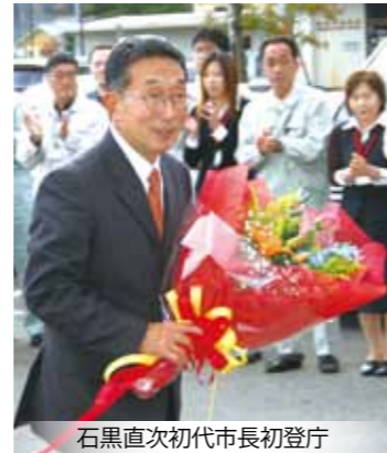
石黒直次初代市長初登庁