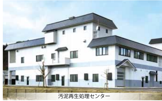
汚泥再生処理センター