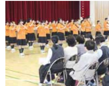
生徒たちの披露する踊りや演奏などに、参加者は楽しいひとときを過ごしました。