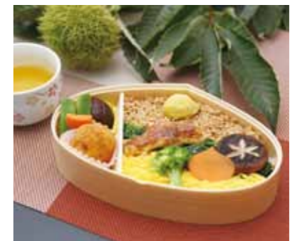
今回の「栗まんま」はさらなる改良を加え、栗の美味しさとことごとくこだわりました。

平成25年度は「秋田デスティネーションキャンペーン」、平成26年度は「第29回国民文化祭・あきた2014」に向けて販売してきた佐竹北家の殿さま弁当「栗まんま」を今年度も販売することになりました。第3弾となる今回の弁当は、これまでの好評を受けて販売を検討されたもので、地場産品を活用した魅力あふれる仕上がりとなっています。