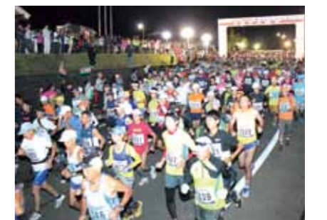
ランナーたちは、暗闇の中スタートし、ゴールの鷹巣まで力走しました。

100キロの部には県内外から1351人がエントリーし、角館交流センターを午前4時30分に、342人がエントリーした50キロの部は、秋田内陸線比立内駅近くを10時30分にスタートし、北秋田市鷹巣のゴールを目指しました。