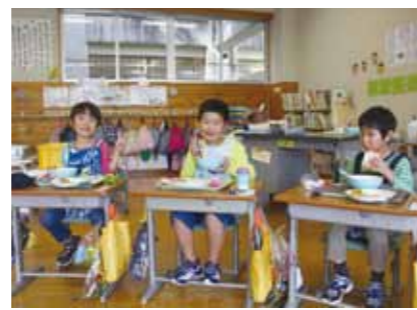
白岩小学校では、地元産の舞茸の美味しさに驚いた様子でした。

原木舞茸は、色や大きさ、香りもよく、3地区で舞茸を使った献立メニューを作りました。芋の子汁やうどんなどで舞茸を