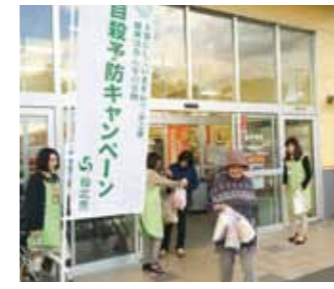
スタッフは買い物客に自殺予防を呼びかけながら、心と体の大切さについて話していました。

当日は行き交う買い物客に、日頃の体調を気遣った「おとうちゃん眠れている？」と印字されたト