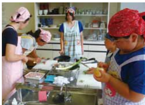
松木内小学校児童と保護者が参加した『おやこの食育教室』

食育に取り組もう! 仙北市では、市民の皆さんが各テーマを通じて「食育」についての取り組みを知っていただくため、仙北市の食育推進事業を掲載しますので、仙北市ホームページに掲載中の計画もあわせてご覧ください。