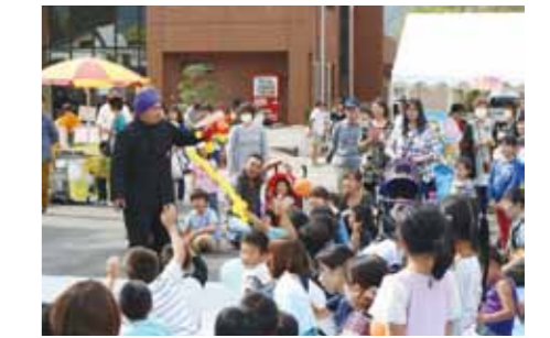
多くの親子連れが集まり、賑やかな雰囲気の中、楽しい休日をお過ごししました。

子どもたちが大はしゃぎ 9月27日、仙北市民会館で「仙北市こどもフェスティバル」が開催されました。