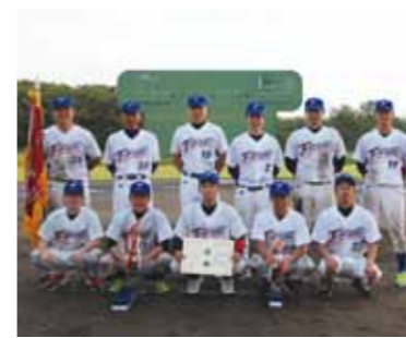
平成18年度以降に開催されたこの大会で、角館消防署は初優勝となりました。