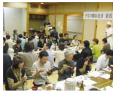
参加者は新そばに舌鼓をうちながら、そば談義に花を咲かせていました。

して活動している団体で、10月から12月にかけては、会員のそば屋で、新そば祭り（スタンプラリー）も行っていきます。