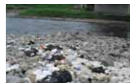
玉川に捨てられた可燃ゴミ

タバコの吸い殻・空きカン・空きビン・ペットボトル・弁当空等、ゴミのポイ捨ても不法投棄同様、明らかな犯罪行為です。特に、火の付いたタバコのポイ捨ては火災の原因にもなり、非常に危険です。河川や水路にゴミを捨てないでください。捨てられたゴミで水路が詰まり、水害を引き起こす可能性もあります。また、河川は仙北市のみならず近隣の市や町、さらには生態系にも大きな被害を与える恐れがあります。絶対にやめましょう。