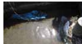
水路に捨てられ、流れてきた紙おむつとビニール