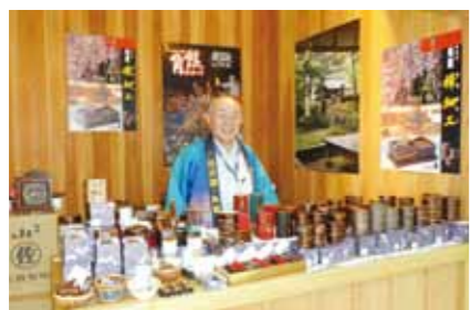
仙北市からは茶筒などの榊細工製品を出展。大館曲げわっぱや会津漆器も出展され、旅行者や見学者は興味深そうに見入っていました。

8月21日から23日まで、日本の魅力発信イベント「ハートフルにつぼん『日本の匠の技展』」が羽田空港国際線ターミナルで開催されました。 このイベントは、日本国内の伝統と文化を世界に発信し続けている東京国際空港ターミナルと、仙北市で地域活性化のお手伝いをしていくANA総合研究所（観光課内）の共通する活動趣旨で実現したものです。