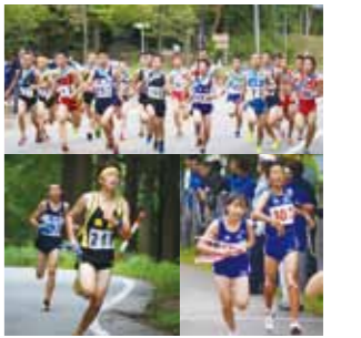
選手たちは、たすきをつなぎながら、各区間懸命に走り抜きました。

8月27日、田沢湖畔で「第45回大曲仙北中学校田沢湖一周駅伝競走大会」「第20回大曲仙北中学校田沢湖女子駅伝競走大会」が行われ、男子26チーム、女子25チームが参加しました。男子7区間20・6kmは美郷Aが1時間6分43秒、女子（5区間12・6km）は美郷Aが45分27秒で優勝しました。 ◇成績は次のとおり（市内中学校） 【男子】▼4位神代A▼7位角館A▼11位角館B▼13位生保内A