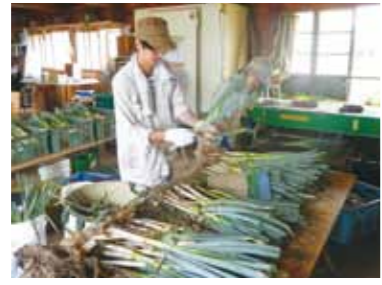
農業体験では、ネギの出荷作業などをお手伝い。このほか、空き家での自炊生活など田舎暮らしの醍醐味を体験しました。

8月19日から6日間の期間、仙北市内で「農林業で田舎暮らし体験事業」が行われ、首都圏在住の若者が、田舎暮らしと農業などを体験しました。 体験メニューは、農業をはじめ、就農相談や榊細工制作などで、移住を見据えた空き家の見学、空き家での自炊生活もありました。 また、受入農家の好意により、大仙市の園芸メガ団地の見学も行いました。