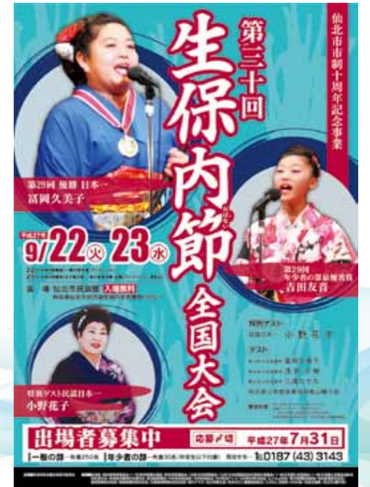
第30回生保内節全国大会ポスター