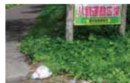
公園入り口に捨てられたゴミ