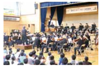
【東京フィルハーモニー交響楽団】1911年創立。日本最古のオーケストラ。定期演奏会を中心とする自主公演や教育プログラムなどの国内活動、海外公演で高い評価を得ている。

8月27日、角館小学校体育館で東京フィルハーモニー交響楽団のオーケストラ公演が行われました。これは、毎年文化庁が行っている「文化芸術による子供の育成事業」の一環で、同楽団が北海道と東北の小中学校を対象に、音楽を通じて交流を図っているものです。