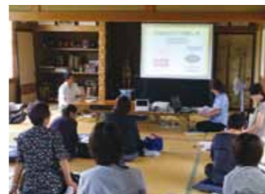
認知症サポーターは、地域で認知症の方や家族を支える応援者です。ぜひ、皆さんの身近なところでも開催をしてみませんか。