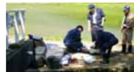
警察・不法投棄監視員による現場検証