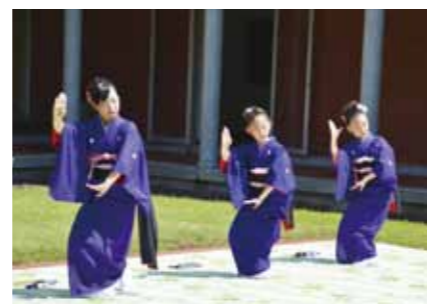
実演の見学は無料で行っていただけますので、お気軽にお立ち寄りください。

8月9日から10月25日までの期間中、角館榊細工伝承館では、国指定重要無形民俗文化財「角館祭りのやま行事」の中心的な役割を担う民俗芸能「飾山囃子（おやまばやし）」を、多くのお客様にご覧いただくこと、秋田おばこによる「手踊り」や「お囃子」の実演を行っています。