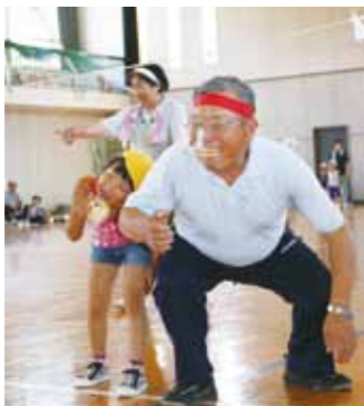
参加者の皆さんは、園児らとハッスルプレーが続く。暑さも吹き飛ばし、なごやかに交流を深めました。

7月27日、吉田体育館（松木内）で仙北市老人クラブ連合会が主催する世代間交流運動会が行われました。 市内老人クラブ会員の皆さんや、ひのきない保育園の園児ら200人を超える参加者が紅白に分かれ、風船取り競争や煎餅食い競争などで競い合いました。 この日は気温が真夏日となり、うだるような暑さにもかかわらず、園児たちの元気なかけ声に参加者たちを元気づけていました。