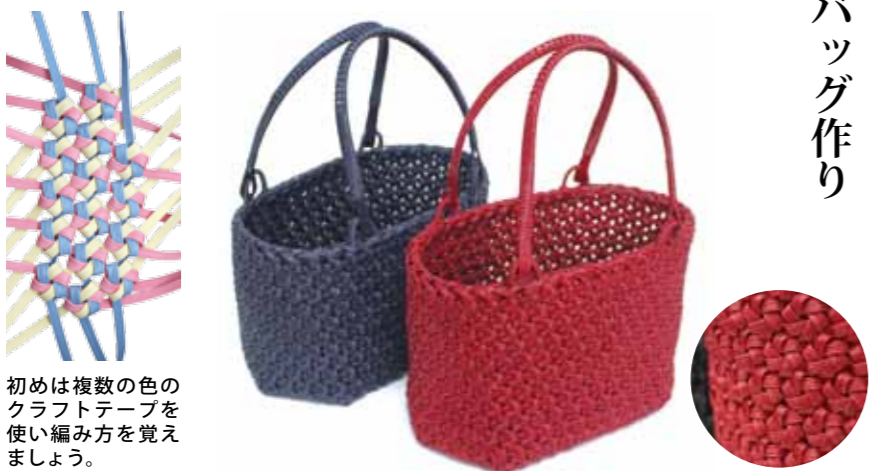
初めは複数の色のクラフトテープを使い編み方を覚えましょう。

生涯学習課 ☎ 43-3383 田沢湖公民館 ☎ 43-1061 角館公民館 ☎ 54-1110 西木公民館 ☎ 47-3100