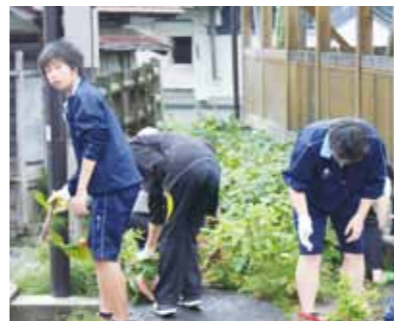
田沢湖駅駐輪場周辺の除草作業に汗を流す生徒たち。毎日通学する駅の保身を心がけていました。

7月26日、栗石高校（若手県）田沢湖地区の生徒が、田沢湖駅駐輪場周辺の除草作業ボランティア活動を行いました。この活動は、毎年学校行事の一環として行われているもので、この日は生徒22人と保護者18人が参加。田沢湖駅周辺の除草を一生懸命行い、心地よい汗を流しました。