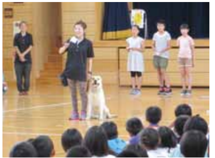
児童たちは、警察犬の賢さや指示どおりの動きに歓声を上げていました。

7月21日、仙北市防犯協会角館支部主催による防犯教室が角館小学校で開催されました。 会場では、警察犬による訓練の実演が行われ、児童たちは警察犬の役割についての話を聞いたり、警察犬とふれあったりして、警察犬についての理解を深めました。 また、仙北警察署の署員やスクールガードリーダー（地域学校安全指導員）による不審者からの身の守り方の指導もあり、児童ら