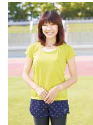
ゲストランナー 高橋尚子さん 2000年シドニー五輪金メダリスト

【申込締切】7月24日 日 【問合せ】田沢湖マラソン事務局（仙北市スポーツ振興課内） ☎43-1116