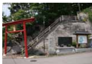
県指定文化財(昭和62年指定)の門屋城址

《問合せ・申込み》 戸沢サミット in 仙北実行委員会 (仙北市教育委員会生涯学習課内) ☎ 43-3383