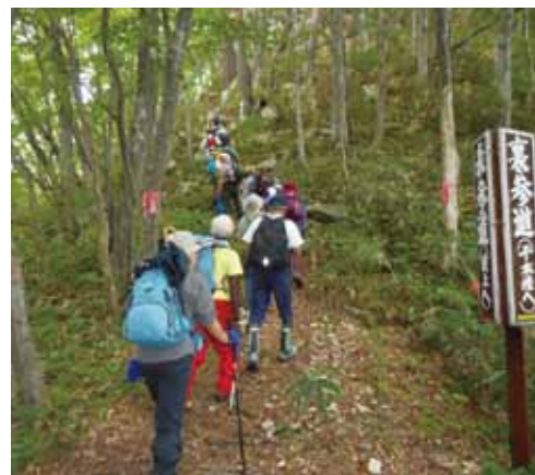
昨年の市民登山の様子(筑紫森)

《日時》6月28日(日) (小雨決行) 集合:8時30分 《ルート》御岳山(750㍎)~黒森山(763㍎)(約2時間程度) 《参加料》100円(保険料) 《集合場所》角館公民館駐車場(角館武道館裏側) 《持ち物》食料・飲料・タオルのほか、雨具や重ね着のできる衣類等 《募集定員》24人(先着順締切) 《申込期間》6月1日(日)~24日(日) 《問合せ》角館公民館