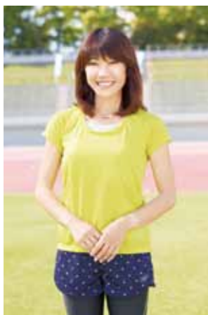
ゲストランナー 高橋尚子さん 2000年シドニー五輪金メダリスト