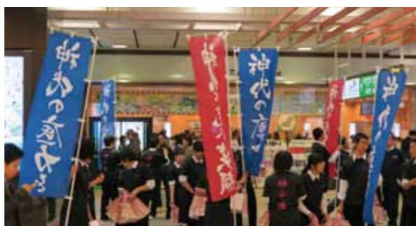
大勢の人が行き交う中でのPR活動。受け取った袋を喜んでくれる方々に生徒たちも話はずみしました。