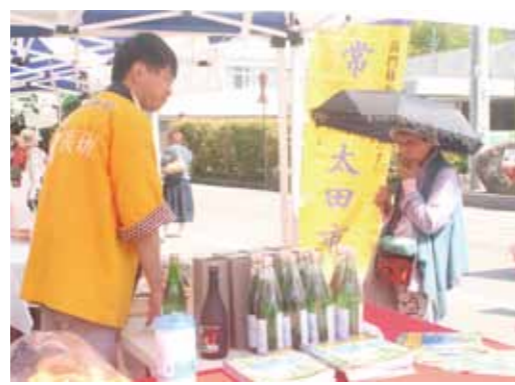
物産展では、めずらしい商品が所狭しと並び、多くの買い物客がお目当ての商品を買い求めていました。

角館の桜まつり期間中の恒例行事となっている仙北市との姉妹都市・連携交流都市（長崎県大崎市、茨城県常陸太田市、秋田市）の物産展が4月29日、30日と仙北市役所角館庁舎前の特設テントで開催されました。