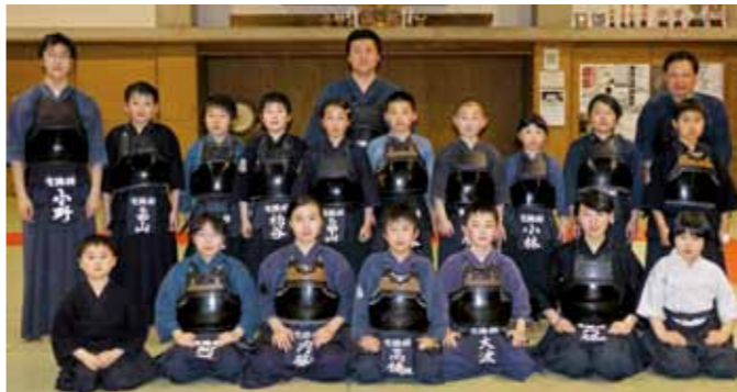
活動日時 毎週火・水・金曜日 19:00～21:00 活動場所 角館武道館 会員数 30人

見学は随時受付しています。直接、稽古の日に角館武道館にいられてもかまいません。初心者の方でも大歓迎です。一緒に汗を流しませんか。