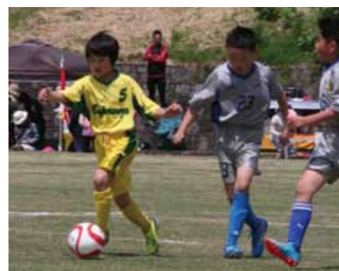
選手たちは激しい攻守で白熱の戦い。《試合結果》優勝・西仙北FC、準優勝・北秋田市レッキスサッカー少年団、3位・FC角館セレジェスタ

5月5日、第13回あきた南北ジュニア強化サッカー交流大会「さくらカップ」が玉川河川敷運動公園で開催されました。