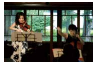
昨年7月の古民家コンサート

ビッキ倶楽部に今年もまた、超一流のクラシック演奏家がやってきます。チェロとピアノの男性デュオ、奥深くそして繊細な音色が紡ぎだす極上のメロディーが、あなたの魂に優しく語りかけてくれることでしょう。五月の爽やかな風の吹き抜ける古民家で、心安らぐ癒しのひとときを…。 【日時】5月23日 月 14:00 開場 15:00 開演 【出演】古川展生(チェロ) 塩入俊哉(ピアノ) 【会場】古民家ビッキ倶楽部(田沢湖生保内字相内端63) 【入場料】全席自由 大人3,000円 中学生1,000円(税込) 小学生無料(大人同伴) ※未就学児童の入場はご遠慮ください。 【予約・問合せ】3 W田沢湖事務局 土屋 ☎ 43-2370