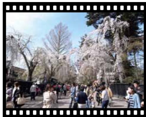
昨年の角館の桜まつりの様子

かくのだてフィルムコミッションは町村合併前の角館町時代に、まちづくり団体、観光協会、商工会等の角館の団体組織で構成されて設立。そのまま引き継がれてきましたが、昨年度から田沢湖、西木町の団体組織等にも新たに関わっていただく