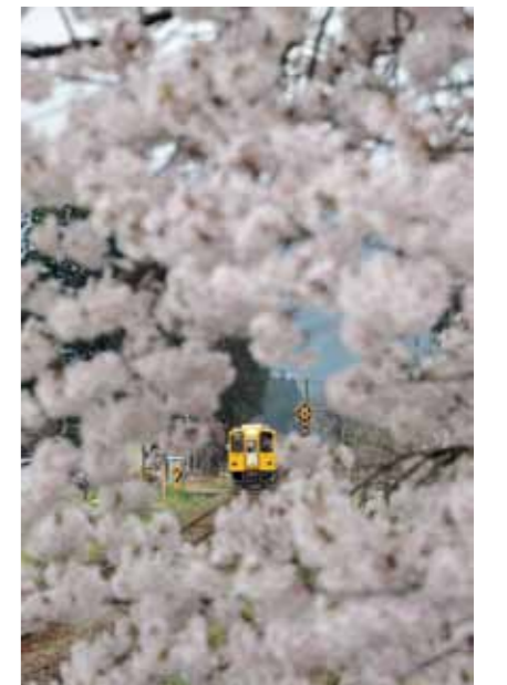
西明寺駅

秋田内陸線は四季折々の大自然を堪能できる路線です。秋田新幹線が接続する南の玄関口角館にて、内陸線沿線が一番よく知る2人の運転士が撮影した写真展を開催し、その魅力をたっぷりご紹介いたします。 【会期】平成28年3月31日 月まで 【時間】9:30～17:00 【会場】内陸線角館駅に隣接する休憩所「スタシオン」 【展示内容】▶4～9月…おもに春～夏の風景を展示します。計20枚。▶10～3月…おもに秋～冬の風景を展示します。計30枚(予定)。 【問合せ】秋田内陸線貫鉄道株式会社 事業課 ☎ 0186-82-3231