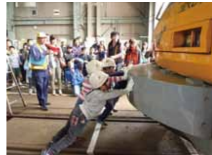
車両基地での体験見学

今年で4回目となる秋田内陸線のりものまつり!今年も秋田内陸線阿仁合駅周辺に内陸線をはじめとする、様々な乗り物を盛大に展示します。人気の救急車・パトカー・白バイのほか、今年も乗車体験車両としてミニSLやほろ馬車を用意しています。当日は、馬肉シチューをはじめとした内陸線沿線のおいしい食べ物を集めた飲食・物販コーナーのほか、内陸線車両基地の見学、運転手体験など様々なイベントもあります。県内各地のゆるキャラたちも大集合!秋田内陸線も増結運行しますので、この機会にぜひ内陸線で遊びに来てね! 【日程】5月16日 月～17日 月 【時間】2日間とも9:30～15:00(入場無料) 【場所】秋田内陸線阿仁合駅周辺 【臨時列車】のりものまつり臨時運行時刻阿仁合行▶角館7:42→羽後太田7:47→西明寺7:51→八津7:56→羽後長戸呂8:02→松葉8:06→羽後中里8:11→左通8:17→上松木内8:20→戸沢8:26→阿仁合9:07 【問合せ】秋田内陸線のりものまつり実行委員会 ☎ 0186-82-2114