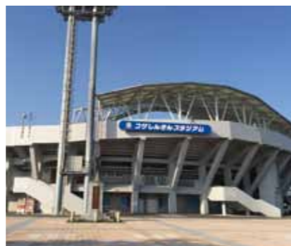
コザしんきんスタジアム