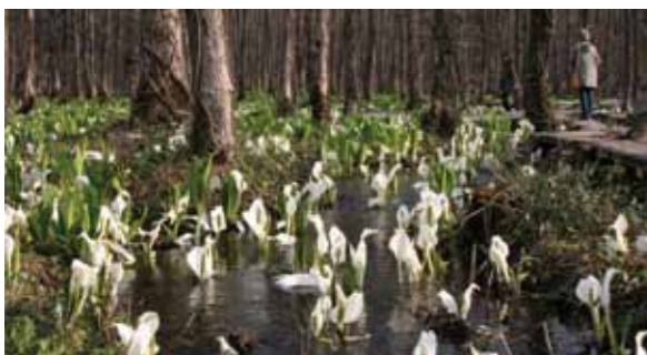
刺巻湿原の「水ばしょう祭り」は5月6日まで開催されています。この機会にお見逃しなく！

田沢湖の刺巻湿原では、ミズバショウが見頃を迎え、連日多くの観光客が訪れています。国道46号沿いから見える広さ3ヘクタールほどの湿原に約6万株が群生しており、駐車場もしっかり整備されています。訪れた多くの観光客は、木製の歩道をゆっくり散策したり、雪解け水の中の愛らしい花々をカメラに収めたりして、楽しんでる様子でした。角館の桜、西木のカタクリと合わせ、ゴールデンウィーク頃まで花紀行は続きます。