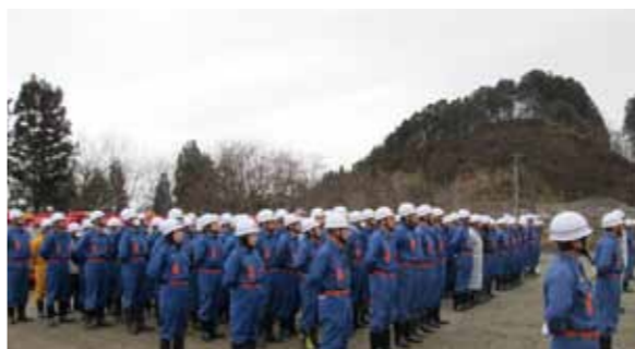
角館地区で実施された駆け付け訓練。きびきびとした団員の動きが印象的でした。

4月5日から11日にかけて実施された「春の火災予防運動」の初日、仙北市内3か所で火災の発生を想定した駆け付け訓練が実施されました。訓練に参加した団員たちは、きびきびとした動きで本番さながらの素早い動きを披露していました。これから気温が高くなる時期は、空気の乾燥により火災が非常に発生しやすい気象状況となります。安全第一を心がけ、火気の取り扱いには、十分に注意しましょう。