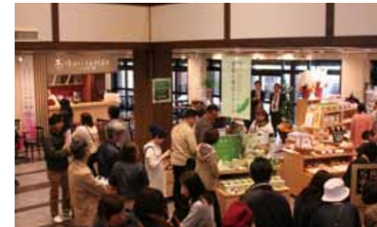
オープンと同時に目当ての商品を買い求めるお客さんでにぎわいを見せていました。

あきた食彩プロデュースが開業を進めていた6次産業化拠点施設「食彩・町家館」が4月19日、旧角館プラザ跡地にオープンしました。1階は飲食と物販に加え地場産品の加工場を併設した「アグリガーデン」、2階は地元野菜を中心としたメニューにこだわったレストラン「町家キッチン」となっています。オープン初日は多くの観光客や買い物客でにぎわいを見せ、お目当ての「限定バイキングお花見弁当」などが好評でした。