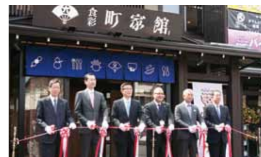
澄み渡る青空の下、角館の中心地にオープンした「食彩・町家館」。記念のテープカットが華々しく行われました。