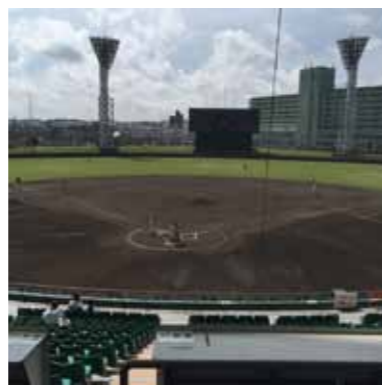
沖縄セルラースタジアム