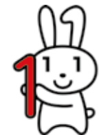
マイナンバーキャラクター マイナちゃん

◎ 民間事業者でも、社会保障、源 泉徴収事務などの法律で定めら れた範囲に限り、マイナンバ ーを取り扱います。