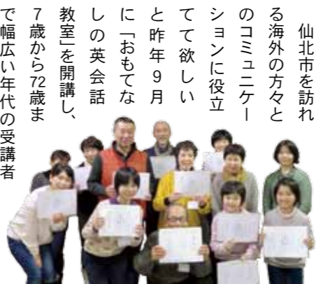
受講者の皆さんには修了証が渡されました。

仙北市を訪れる海外の方々とのコミュニケーションに役立つと昨今、9月「おもてなしの英会話教室」を開講し、7歳から72歳まで幅広い年代の受講者15人が、今年2月に全10回の課程を終了しました。