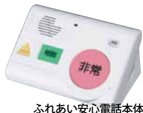
ふれあい安心電話本体

緊急通報装置（ふれあい安心電話）を設置することにより、ひとり暮らしの高齢者や身体障がい者等が急病や災害時に連絡が取れるよう支援します。また、相談機能も備えています。