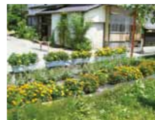
最優秀賞 大曲養護学校せんぼく分教室