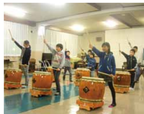
太鼓の音とともに元気な掛け声を響かせて練習に励む『くりっこ太鼓』のメンバー。

毎週水曜日の夜、西木公民館の2階から太鼓の音が響き渡ります。西木地区の子ども達で構成されている『くりっこ太鼓』の皆さんが一生懸命太鼓の練習をしている音です。昨年の国民文化祭では角館駅前演奏を披露するなど、様々なイベントで練習の成果を披露しています。現在、男の子5人、女の子4人みんなで楽しく活動しています。太鼓を叩いてみたいなど興味のある方、新しい仲間を募集しています。お気軽にお問い合わせください。