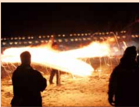
火振りかまくらの体験では、勢いを増す炎に歓声が沸きました。