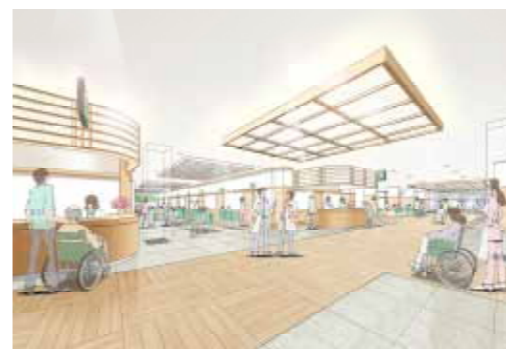
外来受付から待合、主出入口を見た内観イメージ

一般病床の集約と手術部門のみで構成され、静かな環境で療養いただけます。看護ステーションが中央に集約されていることで、緊急時など、他病棟から看護師の応援要請・連携する際に素早い対応が可能となります。また、エレベーターを降りた廊下の先にラウンジを設け、入院患者さんにご家族のだんらんができます。