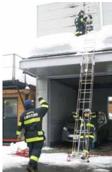
上：はしご設置の注意点を実演。左：消防士の説明を受けながらロープの結び方を習得しました。