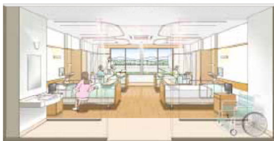
病室内観イメージ