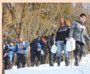
今年も地域と交流のある国際教養大学の皆さんが祭りに参加しました。今回はオーストラリア国立大学の学生も訪れ、祭りの準備も手伝い、交流を深めました。