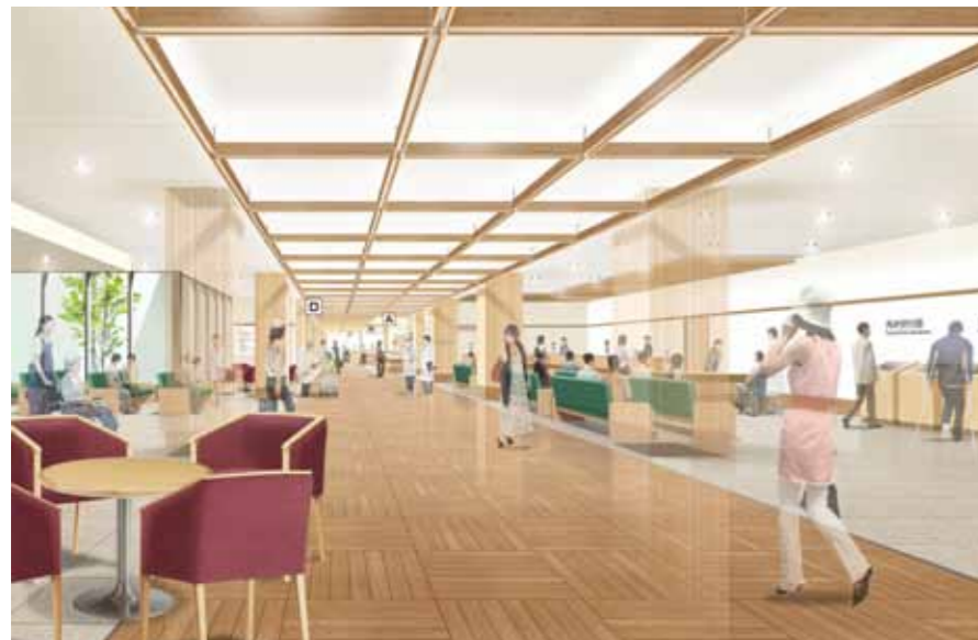
玄関から見た院内のイメージ

また、利用者の皆さんから病院に対する様々な意見も寄せられています。ご意見箱の設置や患者満足度アンケートも実施しています。これらの中で多くの方が不満と感じている項目として、診察や会計までの待ち時間が長い、プライバシーに配慮されていない、駐車場が狭いなどが挙げられました。また、病院スタッフの言葉遣いや接遇に不満を訴える意見もあります。 山積した課題の解決に向け、市民に信頼され、良質な医療を継続的に提供し続けるために、新築による施設整備が必要なる状況となりました。