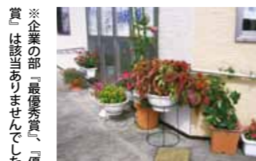
優良賞 ショートステイ田沢湖