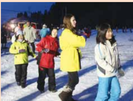
会場で踊りの輪が広がった元気白岩ひでこ節踊り。

かがり火の明かりが祭りを盛り上げ、多彩な催しで賑わう 2月7日、「第14回白岩城址燈火祭」が白岩平城を主会場に行われました。 中世、近世の白岩の繁栄を、本町通りや白岩家城址館山参道のかがり火で再現するこの祭り。午後6時、雲巖寺の鐘の音と共に館山参道にかがり火が灯されると辺りは幻想的な雰囲気になりました。 打ち上げ花火や火振りかまくら、綱引き大会など多彩な催しに、会場を訪れた皆さんが祭りを大いに楽しみました。