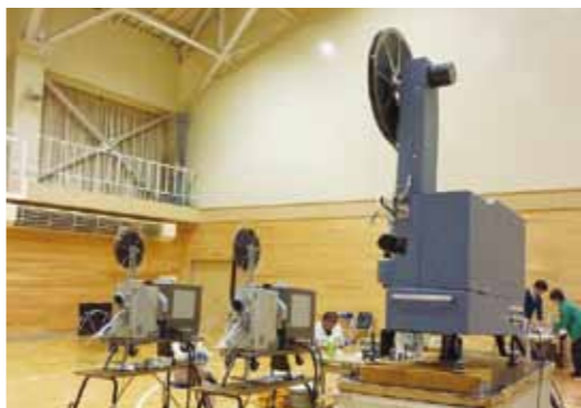
角館高校体育館に映写機を設置し、4本の映画を上映。