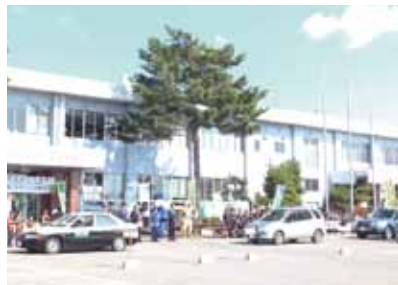
出動式後出席者が見守る中、パトロール隊が乗車し各地に出発しました。

いちゃん、なまはげと共に声援を送る中、パトロール隊は車に乗り込み市内各所に向けて出発しました。 出動式に先立ち、西木総合開発センターで、防犯功労者表彰式も行われ、防犯などで功績があった個人・団体の方々に表彰状が伝達されました。