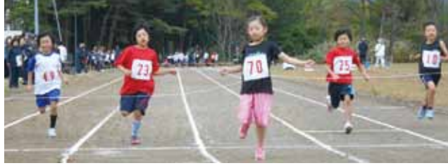
フィールドやトラックで、児童たちが記録に挑戦しました。

10月13日、生保内中学校陸上競技場で第9回仙北市スポーツ少年団陸上競技大会が開催され、市内スポーツ少年団から参加した選手たちが、練習の成果を遺憾なく発揮しました。