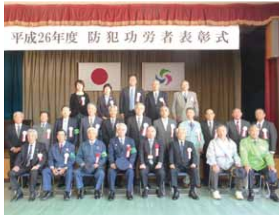
防犯功労者表彰式で表彰を受けた皆さん。

10月11日、市役所西木庁舎駐車場で全国地域安全運動合同パトロール出動式が開催されました。 西木町くりっこ太鼓の皆さんがオープニングセレモニーを盛り上げたほか、西明寺小学校の野球部・バスケットボール部の子どもたちが、県警マスコットキャラクターのまもるくん・あ