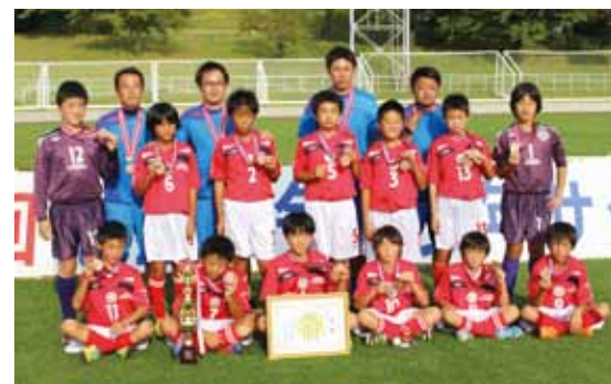
過去最多の73チームが参加する中、見事に3位入賞となったFC角館セレジェスタ。

9月20日・21日、23日、第34回魁星旗争奪少年サッカー大会にかほ市で開催され、FC角館セレジェスタが全県3位の成績を収めました。過去最多の73チームが出場したこの大会。16組に分かれて行われた予選リーグを、4戦全勝で通過した角館は決勝トーナメントも3試合を勝ち進みました。準決勝でスポルティフ秋田アミーゴスに敗れましたが、3位決定戦で御所野サッカースポーツ少年団を3対1で破りました。12月13日から宮城県で開催予定のフジパンCUP東北少年サッカー大会に出場します。