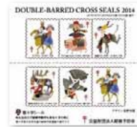
※収益金は、結核予防の普及啓発活動、開発途上国への結核対策支援等に活用しています。

結核の予防には、普段から健康的な生活を心がけ、免疫力を高めておくことが重要です。 【目的はひとつ。結核のない明日をつくるために】 結核をなくすための複十字シール募金運動にご協力ください。