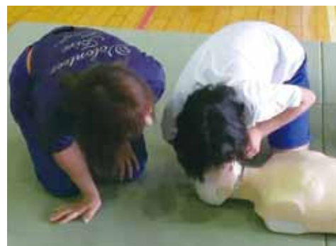
心肺蘇生法などの応急手当を指導しています