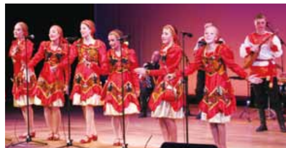
鮮やかな衣装に身を包み、数々の楽曲で会場を魅了した、民族吹奏楽団ヴィシェンカの皆さん。

ロシア国内や国際コンクールで、数々の賞に輝く、ロシアの伝統民族吹奏楽団ヴィシェンカ特別演奏公演が、仙北市民会館で開催されました。様々な民族楽器を巧みに操り、すばらしい演奏に乗せてロシアに伝わる民謡や童謡、舞踊を披露しました。