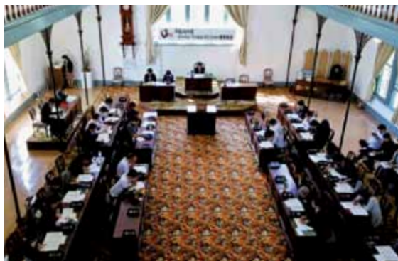
総会会場の新潟県政記念館(重要文化財)

総会前には、地域発の映画「飛べダコタ」の上映会、シンポジウム「地域発の映画制作について」が行われました。シンポジウムでは、「飛べダコタ」の映画製作は、佐渡市役所の職員が映像関係者約3500人に企画提案書を送ったことから実現した事例が紹介されました。佐渡市民6万人中2000人がエキストラ協力し、1万人が映画を観たそうです。地域で主体的に企画し、地域で愛される映画の撮影に結びつけることは、参考になる事例と思いました。