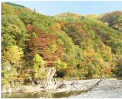
溪谷を飾る色とりどりのグラデーションは、天候や時間帯によって様々な姿を見せてくれます。

「抱返り紅葉祭」 11月10日(月) 問合せ／抱返り紅葉祭実行委員会事務局(一般社団法人 田沢湖観光協会内) ☎(58) 0063