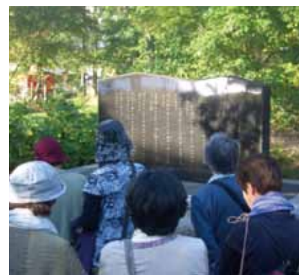
歌碑を巡る参加者 (斎藤茂吉歌碑)

10月11日 田に田沢湖・角館短歌大会歌碑巡りが開催されました。当日は好天に恵まれ絶好の歌碑巡り日和となりました。県内外から短歌愛好家29人が参加し、仙北市北浦史談会の案内で、角館駅を出発、武家屋敷通りを散策し平福百穂歌碑を見学したあと、田沢湖畔にある昭和天皇御製碑、斎藤茂吉歌碑など市内に点在する歌碑7か所をバスで巡りました。