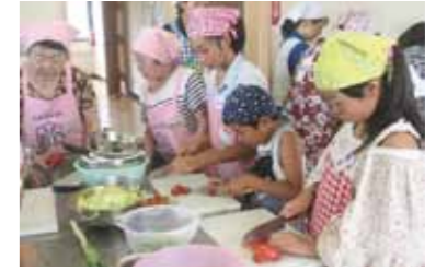
説明を聞き調理に挑戦

小学生が保護者の皆さんと参加する「レッツ！チャレンジ健やかクッキング教室」が開催され、児童、保護者が調理を通し、バランスのとれた食事の大切さについて学びました。