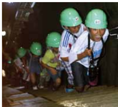
堤体内の階段は急傾斜。手すりを掴み、足下に気をつけて登ります

また、昼食後には名刺交換や実験コーナー、クイズラリーなどのアトラクションを通じて交流を深めました。