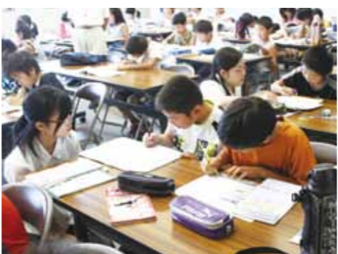
フレッシュオタスケマン（高校生）の説明を受けながら、課題を進める子どもたち

参加した子どもたちからは「友達と勉強できるので楽しい」「家ですより勉強が進む」との声も聞かれました。