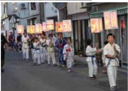
灯籠を手に街をパレード