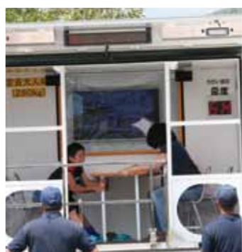
震度7の揺れを体験できる体験車両には行列ができました

昭和35年8月3日発生した田沢湖水害、昨年8月9日発生した先達地区での土石流災害を教訓とし、忘れることなく語り継ぐため、仙北市は8月3日から9日を防災週間に、また、8月を防災月間に制定しました。