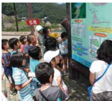
玉川ダムの役割が説明され、一つ一つメモを取る児童たち