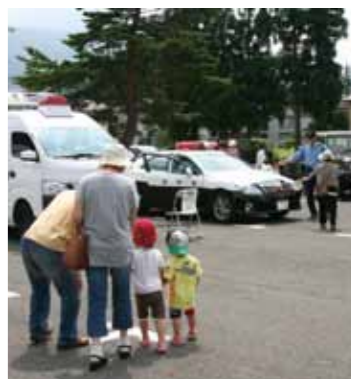
車両の展示は子どもたちにも大人気

8月2日、仙北市民会館前駐車場を会場に、啓蒙活動の一環として「仙北市防災の集い」が初開催され、消防・警察・自衛隊や国交省など関係機関の協力で車両展示のほか、放水、レスキュー体験も行われました。