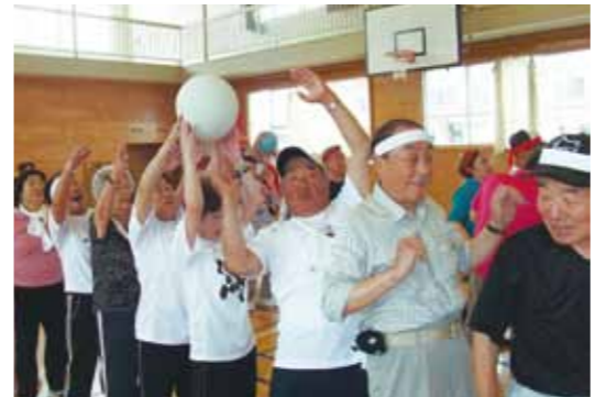
工夫を凝らした競技で、熱戦が繰り広げられました

7月28日、神代市民体育館で仙北市老人クラブ連合が主催する世代間交流運動会が行われました。市内老人クラブ会員の皆さんや、神代子ども園の園児ら200人を超える参加者が紅白に分かれ、風船取り競争やスプリンリレーなどで競い合いました。園児たちのかわいかけ声に参加者も力をもった大会は大いに盛り上がり、楽しい一日となりました。