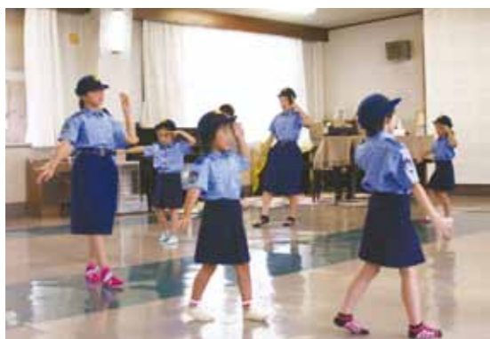
社中の踊り手の子どもたちが制服姿で踊りを披露しました

振り込め詐欺の対策として利用される、振り込め詐欺防止音頭への振り付け発表会が、7月22日に西木公民館で行われ、踊り手の子どもたちが輪になり、踊りを披露しました。