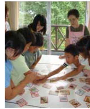
カルタを使って食育ゲーム

小学生が保護者の皆さんと参加する「レッツ！チャレンジ健やかクッキング教室」が開催され、児童、保護者が調理を通し、バランスのとれた食事の大切さについて学びました。