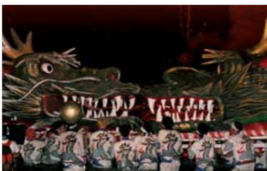
担ぎ手には 秋田大学の留学生や、辰子姫と八郎太郎の繋がりから大湯村の方々も参加しました