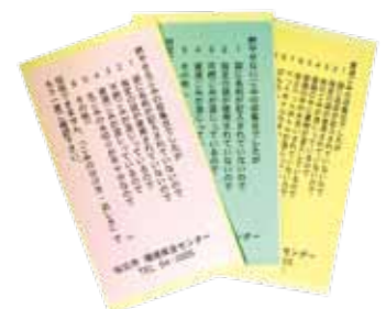
回収されないゴミ袋にはシールが貼られています。