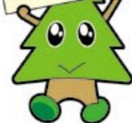
秋田県マスコットスギッチ