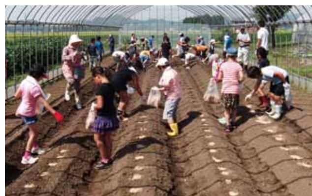
6月に植えたべに花とともに成長が期待されます。

これは、べに花を使用した「いぶり大根」を地域の特産物にしようと、神代地域運営体と神代小学校が連携。生産から収穫、加工を一緒にいき、販売を目指します。