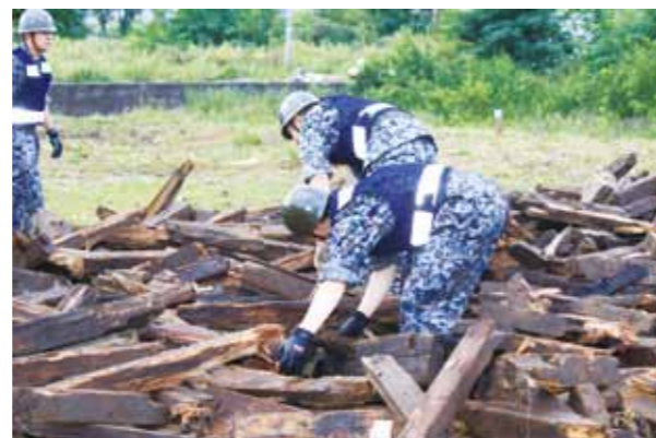
▲自衛隊による瓦礫内の搜索訓練の様子

にあたります。当日は朝5時30分に大地震が発生したとの想定で、津波警報発令→避難勧告→避難所開設といった流れで行われ、自分も山田町で初めての総合防災訓練に参加しました。訓練の一昨日には外国の地震で岩手県沖太平洋にも津波注意報が発令され、昼夜を問わず気が抜けません。