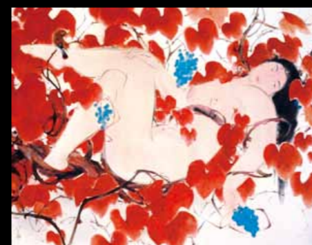
「山葡萄 1933年 第5回青龍社展」 大田区立龍子記念館蔵

川端龍子という大正から昭和にかけて活躍した日本画家について知ることのできる絶好の機会ですので、ぜひ三館へ足をお運び、芸術の秋をご堪能ください。