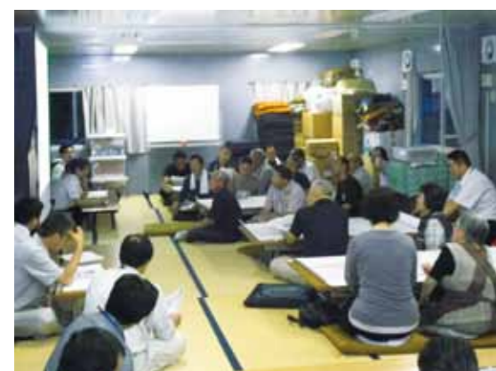
8月8日（水）住民説明会の様子

4月の赴任から早いもので半年が過ぎようとしておりますが、前回のレポートでお話した「防災集団移転促進事業」や「高台道路新設事業」などの事業もとりわけ順調に進んでおり、何よりも住民の方々が一致した協力姿勢の賜物だと感謝しております。