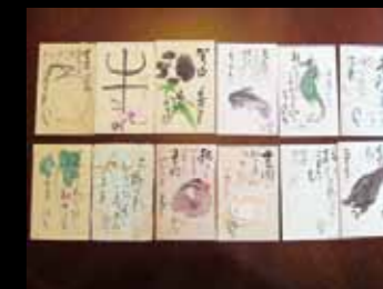
「龍子直筆年賀状」個人蔵 © Katsura Kawabata & Minami Kawabata 2012/JAA1200166