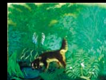
「立秋 1932年 第4回青龍社展」大田区立龍子記念館蔵 © Katsura Kawabata & Minami Kawabata 2012/JAA1200166

画家龍子を代表する青龍社展出品作品、軸装作品をはじめ百穂との交流を示す資料等を展示