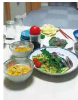
▲地元漁師の方から頂いた今季初秋刀魚の刺身、ウニ、イカ刺しなどの減多にない豪華夕食の一品です。

前回のレポート後、帰省時によく「どごさ住んでるの？」とか「メシはどうしてる？」とか聞かれましたが、自分は宮古市津軽石という山田町のすぐ隣にある仮設住宅に住んでおり、当然ながら自炊の生活をしております。今後も岩手県山田町レポートを送りたいと思います。お読みいただきありがとうございます。ありがとうございました。