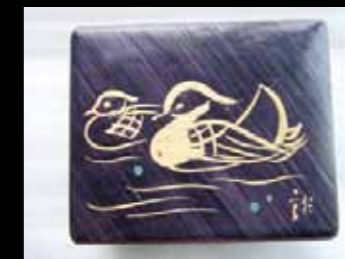
「龍子図案 麦藁張り細工」個人蔵 © Katsura Kawabata & Minami Kawabata 2012/JAA1200166