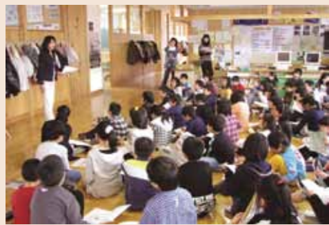
歴史案内人から学ぶ本格的な案内人学習を経て、実際に観光客が訪れる武家屋敷や檜木内川河川敷にてかけます。