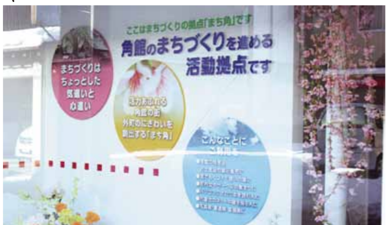
岩瀬町旧ソニックにオープンした活動拠点。パソコン、テレビ設置でたまり場にもなりそうです。

「大きな特徴は、町なかにも活動拠点を用意したこと。町なかだからできる明るい事業をどんどん進めます」と、本格的な活動開始に向けて熱意の事務局でした。