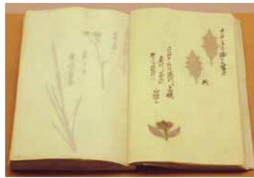
「花葉集」佐竹北家7代の当主佐竹義文が江戸から帰る途中の珍しい草花を押し花にしたもの。

昭和二十年代後半に、白岩焼、樺細工などの工芸品が秋田県から指定を受けたのが角館の文化財の始まりです。その後、昭和四十九年シダレザクラ、檜木内川堤(サクラ)、伝建群と国に指定されます。これらの指定には各保存会の活動が貢献しています。 文化財といってもいろいろなものがあります。伝建群のように暮らして溶け込んでいるもの。家庭の中で大切に保管されてきたもの。歴史資料として価値のあるもの、技術が優れているもの。昔のものを大切に作る町民性のお陰か、相当数の文化財があるのも自慢のひとつ。それぞれの文化財をつなげてみると、昔の角館の姿が想像できます。