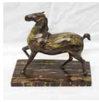
立体の造形にすぐれた寺沢角太郎作、樺細工「馬」