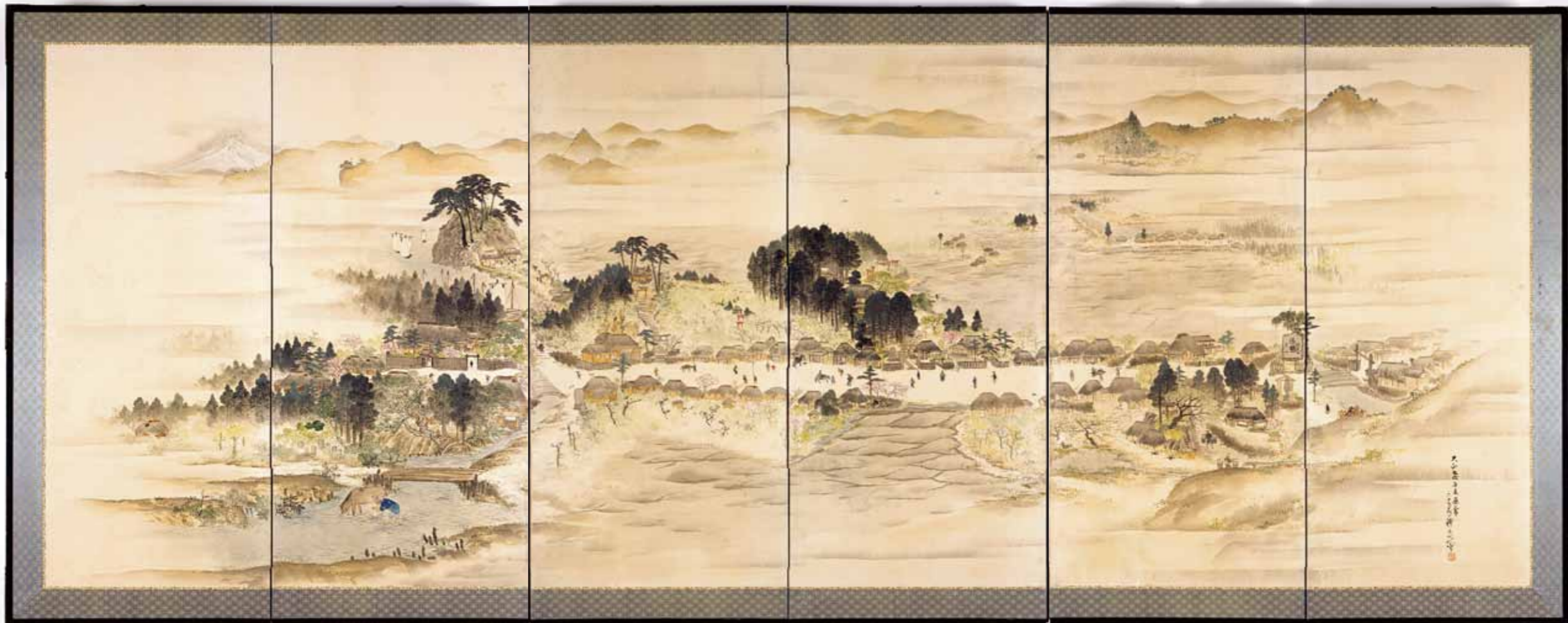
岩瀬風景図 大正七年に西宮礼和が描いた岩瀬の風景。旧時代の岩瀬街道を偲ぶことができます。写真中央の杉林の丘は神明社、その左は天神山、その右は玉川の船着き場と呼ばれたところ。道路をはさんで小館の役所、街道の右端は下岩瀬町境門、門の前に湯殿山の石大石碑、後方は小館、小倉山・太平山・西長野の三角山、遠くには鳥海山も望めます。