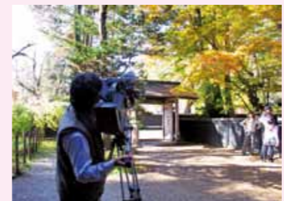
かくのだてフィルムコミッション (仙北市観光課内) ☎ 43-3352 http://kakuodate-fc.jp/

今年の紅葉は厳しい冷え込みが少なかったせいか、例年より色づきが遅いように感じました。しかし抱返り溪谷や武家屋敷には連日多くの観光客の皆さんが訪れ、赤や黄色に彩られた木々や町並み・溪谷を散策している姿を数多く見受けました。特に今年、教育委員会文化財課で伝承館通りのシダレザクラの手入れで薬剤処理を行ったところ、紅葉の色づきがきれいにしているように感じました。