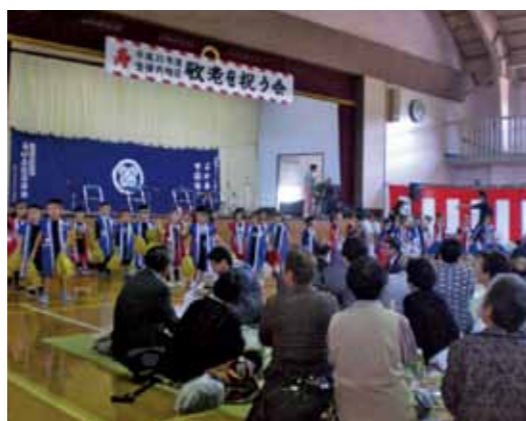
から、久しぶりに会う仲間と話の花を咲かせていました。

式典では今年で満80歳（傘寿）を迎えられ、会場にいられた一人ひとりに記念写真が手渡されました。また、祝宴では、だしのこ園児たちの歌や遊戯のほか、さまざまな団体から芸能披露があり、参加された方々は、披露された歌や踊りを楽しみました。