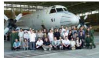
平成23年度研修視察(海上自衛隊八戸航空基地で)