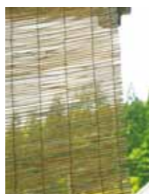
すだれで日差しを和らげる