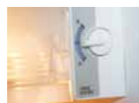
冷蔵庫の設定温度は「中」に