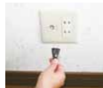
使わない電化製品はコンセントを抜く