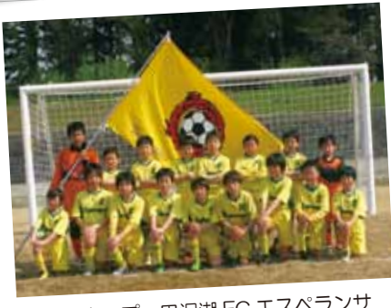
さくらカップ 田沢湖 FC エスبرانサ