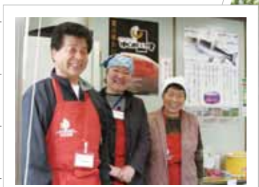
刺巻ミスバショウ 笑顔で皆さんをお出迎え