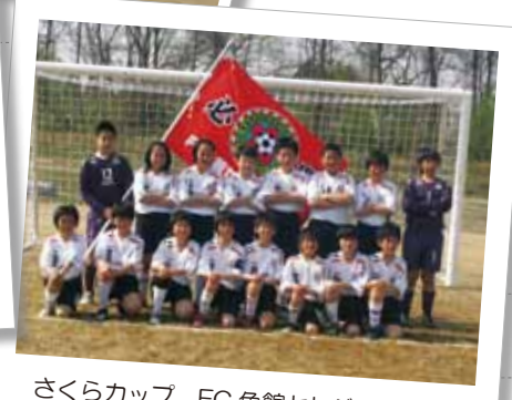
さくらカップ FC角館セレジェスタ