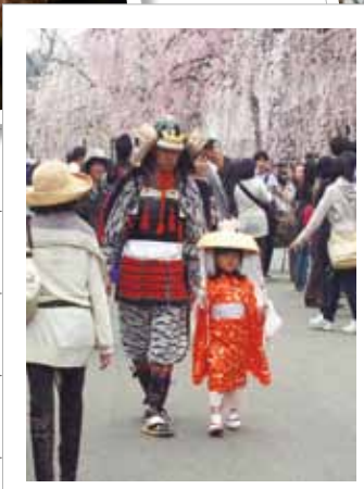
がんばろう！東北 角館の桜 武家屋敷通りでは、こんな姿も