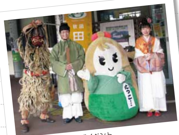
こまち全線運転再開歓迎イベント 田沢湖駅では、辰子姫・八郎太郎・ たっこちゃん・なまはげがお出迎え