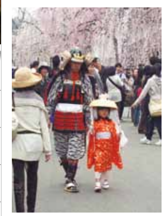
がんばろう！東北 角館の桜 武家屋敷通りでは、こんな姿も