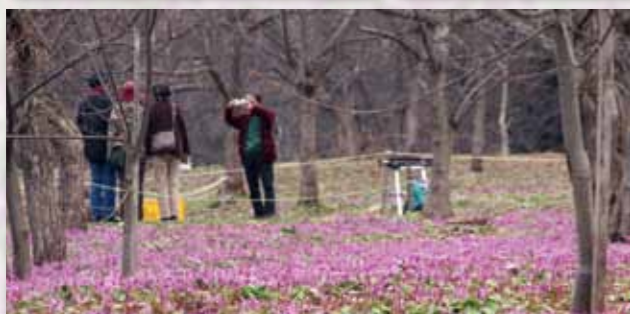
八津・鎌足がたくり群生の郷 4月22日から5月5日まで開催され、無数に咲いた花を楽しむことができました。