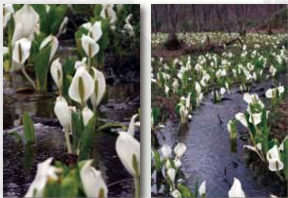
刺巻ミニズバシヨウ祭り 期間を5月7日まで延長して開催され、水辺に咲いた花が心を和ませてくれました。

受付場所 ／田沢湖・角館・西木地域センター、田沢・神代・桧木内・上桧木内出張所 ※出張所は、平日のみの受付となります。