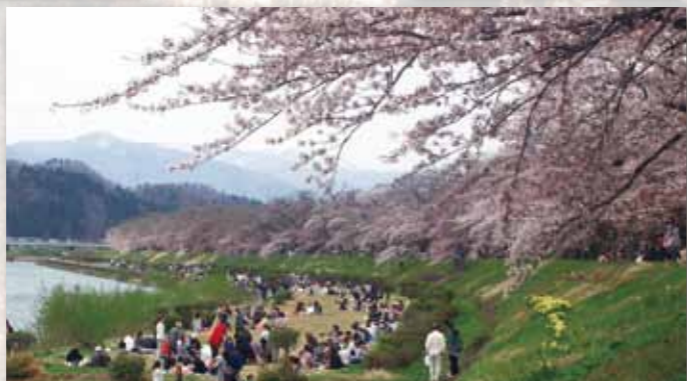
がんばろう!東北 角館の桜 5月8日まで開催期間を延長し、連休の後半には見頃を迎えました。