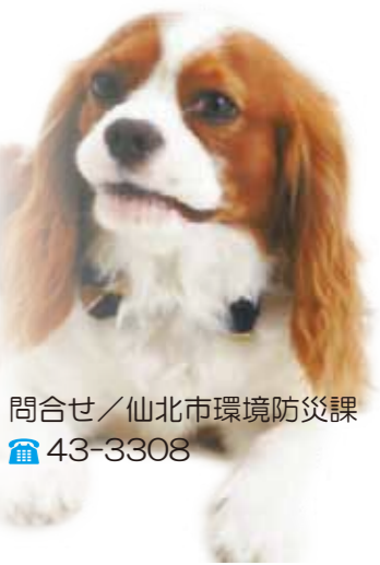
問合せ/仙北市環境防災課 ☎43-3308

生涯1回の登録と、年1回の狂犬病予防注射を必ず受けましょう。 ◆料金/登録料 1頭につき3000円 注射料 1頭につき3070円