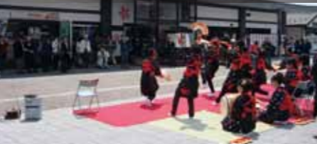
角館駅前で行われた角館南高生の郷土芸能

こまち全線運転再開 歓迎イベント 東日本大震災後区間運休していた秋田新幹線こまちが4月29日に全線運転再開になったことにもな、田沢湖駅、角館駅で歓迎イベントを行いました。駅では「がんばろう日本！がんばろう東北！」と書かれた横断幕を掲げ、出迎えられた利用者にプレゼントの品を渡して歓迎しました。