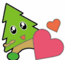
秋田県マスコット スキッチ

〒011-0905 秋田市寺内神屋敷3-1 秋田県青少年交流センター 2F (財団法人秋田県青年会館内) TEL 018-874-9471 FAX 018-847-6350 http://www.sukoyaka-akita.com/ 仙北市政策推進課 TEL 43-1241