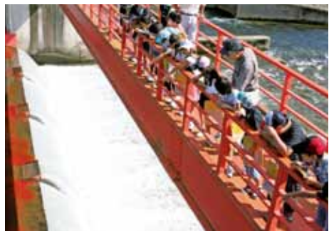
頭首工を間近に見学

子供たちは、はじめに宮田頭首工を見学。頭首工の役割やこの水がどのように使われているか、川へ捨てられたゴミが環境に与える影響などの説明を受けました。次に、西明寺クリーンセンターへ移動し、水の循環と下水道の働きについて学びました。