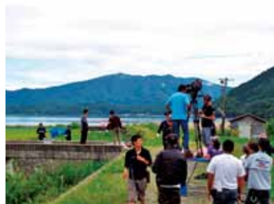
かくのだてフィルムコミッション （仙北市観光課内） TEL 43-3352 http://kakunodate-fc.jp/

目からは連日の雨に泣かされ、ロケスケジュールは大幅に変更。その急な変更にも快く対応してくださった、のべ100人を超えるエキストラの皆様には本当に感謝しています。おかげさまでエキストラ登録も進み、市民の皆様から「この登録はこれからのロケに役立つね」との声も・・・。かくのだてフィルムコミッションが目指す「ロケを受け入れる体制作り」が着実に進んでいることを実感できたロケ支援となりました。エキストラ登録は随時受け付けています。