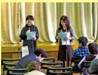
委員たちによる朗読劇