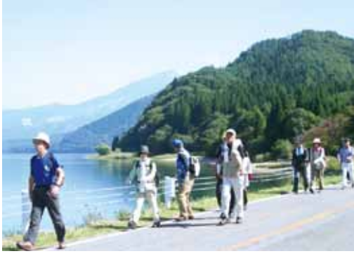
秋晴れの天気足取り軽く

全国から集まった参加者は40キロ、22キロ、12キロ、5キロと用意されたコースに分かれ、それぞれスタート。田沢湖畔や武家屋敷など、秋の景色を眺めながら、ウォーキングを楽しみました。