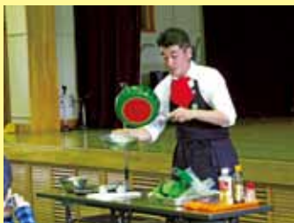
2009年11月「やさしいで女も男も元気に！」