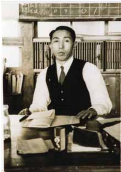
歌集『山河』より抜粋