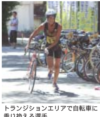
トランジションエリアで自転車に乗り換える選手