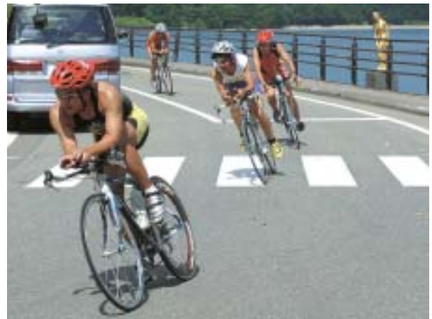
湖畔を平均時速30km以上で走行する選手

デュアスロン競技は、トライアスロンをヒントにアメリカで生まれた競技で、マラソン、自転車、水泳の3種目のうち、水泳をのぞく2種目を連続で行う競技です。