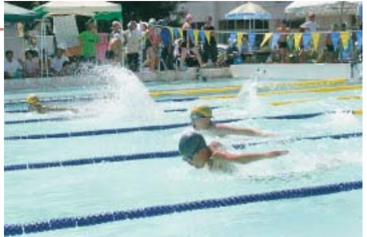
大きな水しぶきを上げ力強く泳ぐ選手たち

第30回きたうら水泳大会が8月27日、角館西小学校プールを会場に開催され、小学生から一般まで13チーム、183人が参加しました。暑い日差しを浴びながら、白い水しぶきを上げ元気に力強く泳ぐ選手たちに、仲間や家族から大きな声援が贈られていました。主な結果は次のとおりです。