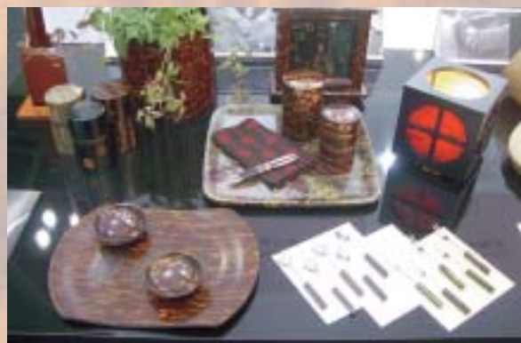
樺細工の新作テーブルコーディネート