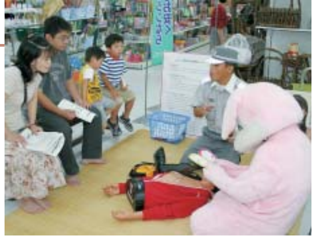
AEDの説明、体験に親子で参加

会場となった角館プラザでは、高規格救急車が一般公開されたほか、AED(自動体外式除細動器)の操作方法や心肺蘇生法の講習が行われ、参加者は実際にAEDの操作を体験し、救急救命の関心を高めていました。