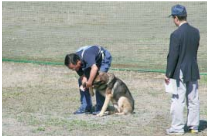
臭いを覚えさせ、かぎ分けさせる選別

当日は、「指導手の命令に従い実行する服従」「犯人の物とされる遺留品を想定し、その臭いをもとに犬にかぎ分けさせる選別」「逃走犯人を想定し、犯人の臭いを頼りに足跡を追う追及」などの競技を行い、捜査活動に必要とされる能力を競いました。