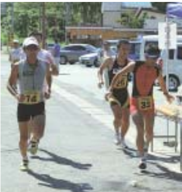
給水ポイントを通過する選手

そのリハーサル的大会として、また、デュアスロンの普及を目的に、9月3日、田沢湖畔と石神地域を会場に、「秋田県デュアスロン選手権2006」が開催され、仙北市内の4人を含む15歳から61歳までの県内の競技者59人が出場しました。