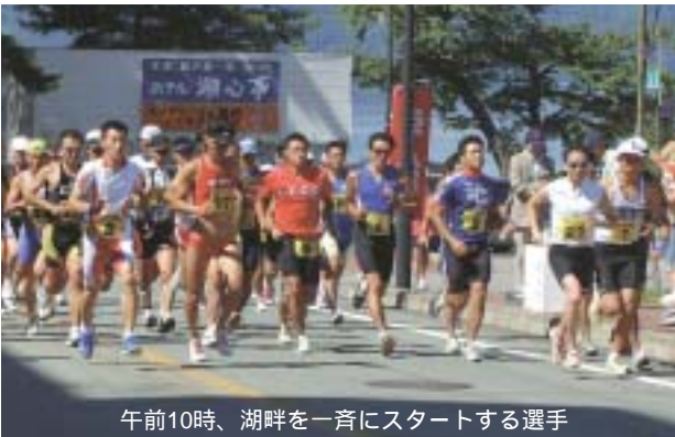
午前10時、湖畔を一斉にスタートする選手

国体競技では本大会とは別にデモ・スポ(デモンストレーション・スポーツ)競技が行われます。秋田わか杉国体では、21のデモ・スポ競技が行われ、仙北市ではデュアスロンが開催されます。