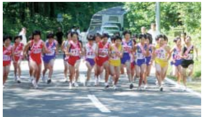
スタートの合図で一斉に飛び出す選手たち

男子は千畑Aチームが1時間7分32秒で優勝、女子は仙南Aチームが45分56秒で優勝しました。