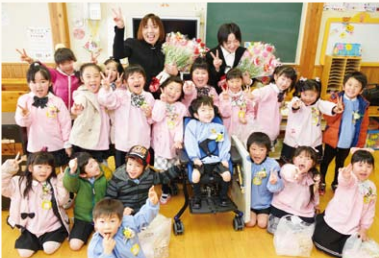
一層の支援が望まれる子育て