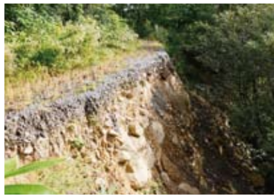
崩落著しい田沢スーパー林道