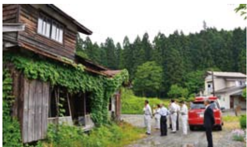
適正管理が求められる空き家対策

な状態で緊急を要するとき、所有者がわからなくて合意を得ることが困難な時はどうするのか。