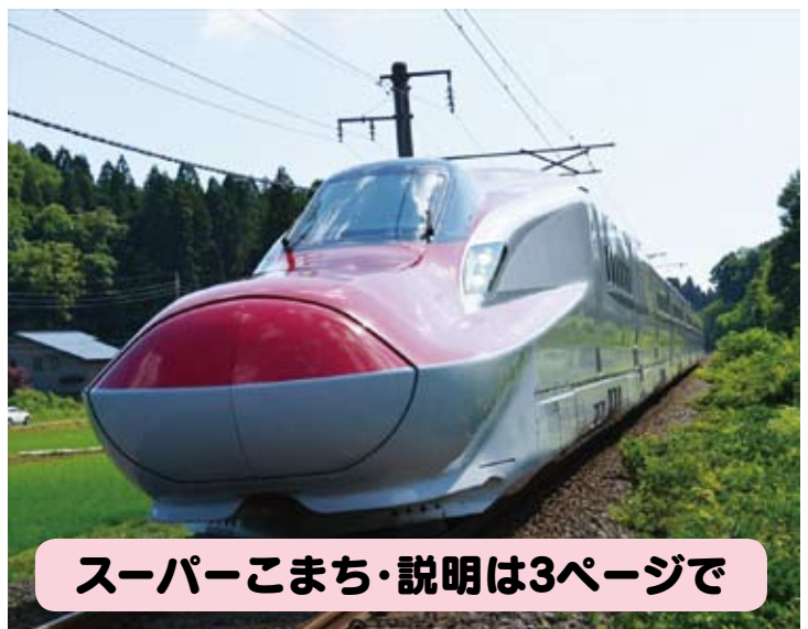
スーパーこまち・説明は3ページで