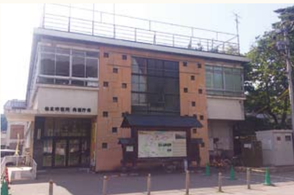
移転の在り方が問われている角館庁舎

答弁 新しいまちをどうつくって行くかというグランドデザインがなければできない事だと思ふ。それを前提に今から進めなければいけない。皆様方からもたくさん意見をいただきたい。(田口寿宜 記)