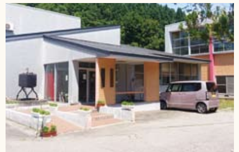
勤労青少年ホーム

答弁 勤労青少年ホームの指定管理料年間250万は、市職員平均年間個人所得の半分にも満たない額である。これだけで人件費、水道光熱費、小破修理費、さらにAEDリース料も