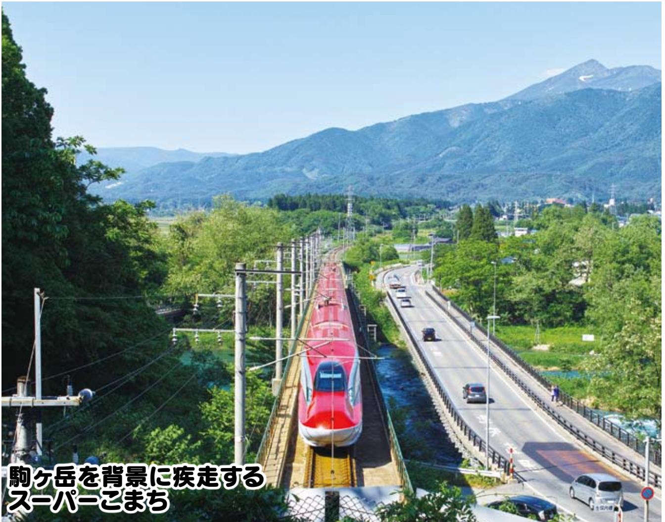
駒ヶ岳を背景に疾走する スーパーこまち

2013年8月1日 発行 発行 仙北市議会 編集 仙北市議会 広報編集・特別委員会