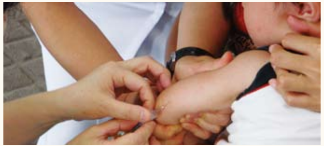
望まれる予防接種の助成対象

質問 福祉灯油の助成について 日本共産党仙北市議団では、市長に2月26日付で、低所得者に対し、暖房に必要な灯油購入費の一部を助成する事を盛り込んだ緊急申し入れをした経緯がある。回答には、予算化の必要もあり24年度においては困難であり、次年度に向けて制度設計を検討したいとの事であった。その検討経過について伺う。 答弁 現在検討中であり、できるだけ簡易な方法で実施できないかという事を