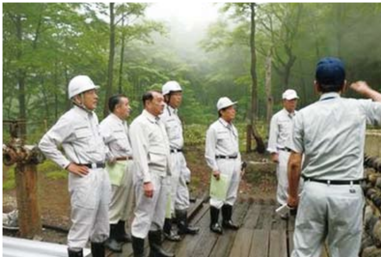
温泉事業カラ吹き源泉を現地視察

の材料にしようとする事に違いはない。6億円を掛けて、市民の血税でこのプラントを実現したが、設計図面にある性能を発電できる基本的な構造にあるかどうか、私の中で疑問である。大規模改修を行っても成果がないのは現実の話である。判断をするために検証に着手しなければ、市民の税金の使い方、適切な運用が出来ない原因になってしまうのではないかという思いである。