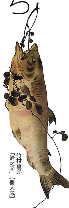
竹村篁那 「鯉之図」【個人蔵】