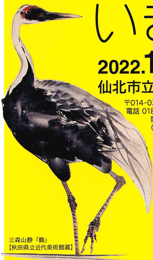
三森山静「鶴」 【秋田県立近代美術館蔵】

〒014-0334 秋田県仙北市角館町表町上丁4-4 電話 0187-54-3888 FAX 0187-54-3890 開館時間 / 午前9時~午後5時 (入館は午後4時30分まで) 料金 / 一般 300円 小中学生 200円 *仙北市民は無料