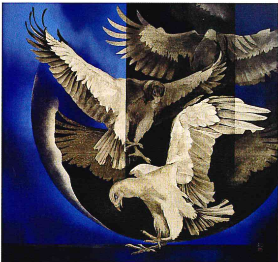
佐々木裕久「鳥偲考-球景」