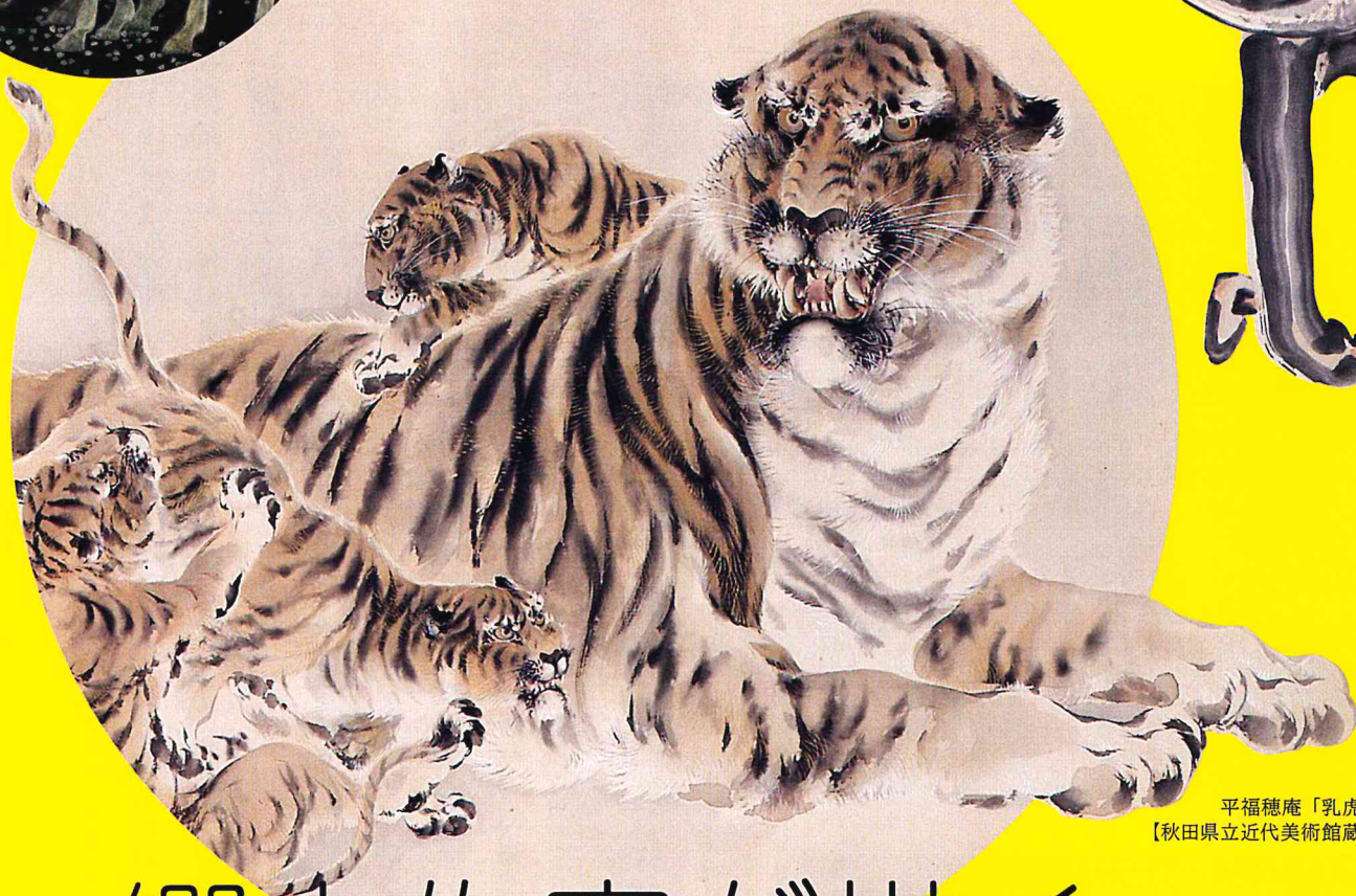
平福穂庵「乳虎」 【秋田県立近代美術館蔵】