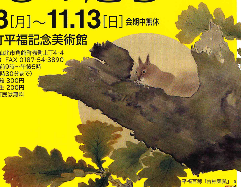
平福百穂「古柏栗鼠」