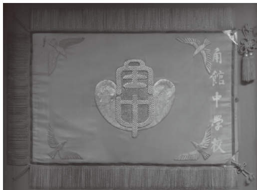
旧角館中学校校旗(パネル展示) (校旗デザイン 福田豊四郎、校名 鳩山一郎 揮毫)