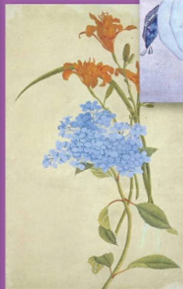
◀ 佐竹義躬公「甘草と紫陽花」 (写生図)