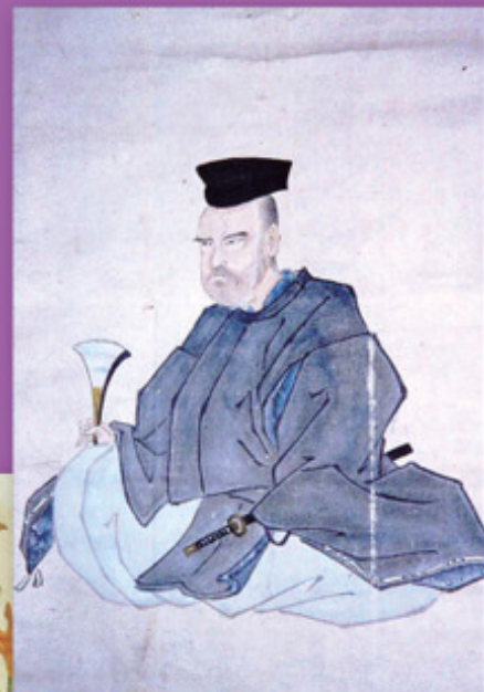
▲ 佐竹義躬公肖像画 (久米山常光院蔵)