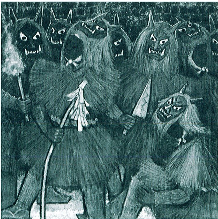
『柴灯祭前』再興第59回日本美術院展 1974