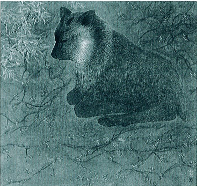
『寂』第52回日本美術院・春の院展 1997

今回、これまで先生が院展で発表された作品を中心に展示いたします。秋田の美しい自然や、風物、生き物、また海外を取材された際に描かれた風景等の作品を、ぜひこの機会にご鑑賞いただき芸術の秋をお楽しみいただくと幸いです。