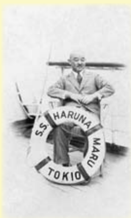
欧州「榛名丸船上にて」