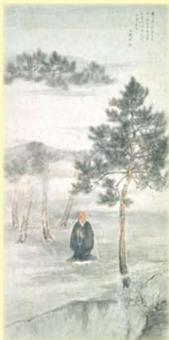
「法然上人」秋田県立近代美術館所蔵

多くの方々にこれら三館にご来場いただき、展示を通して百穂の交友の広さ、芸術への姿勢、生き様を垣間見ることが出来れば幸いです。