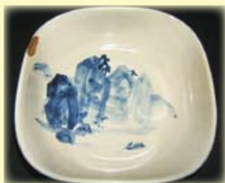
百穂絵付「染付山水菓子鉢」