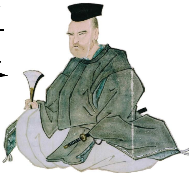
佐竹北家十三代 佐竹義躬公 肖像