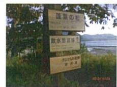
(事業決算額 392 千円)