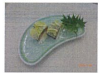
(事業予算額 350 千円)