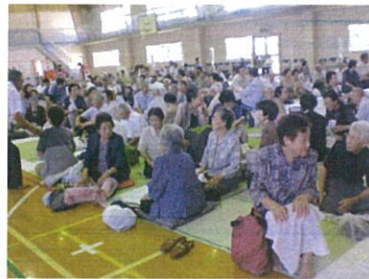
(事業決算額 241 千円)