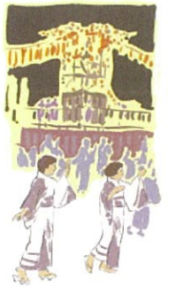
(事業決算額 216 千円)