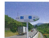
(事業予算額 800 千円)