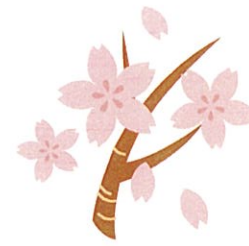
(事業決算額 247 千円)