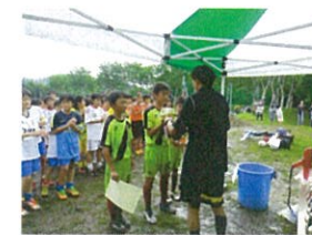
(事業決算額 349 千円)