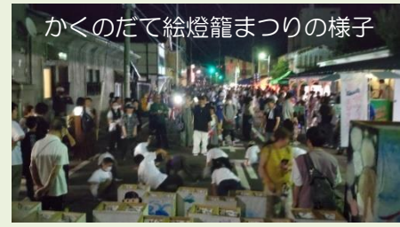
かくのだて絵燈籠まつりの様子

運営体の事務所に借用書がありますので、お気軽にお申しつけください。 〔テント・長机・パイプ椅子・発電機・投光器他〕