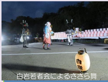
白岩若者会によるささら舞