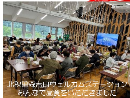
北秋田森吉山ウェルカムステーション みんなで風食をいただきました