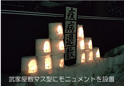
武家屋敷マス型に monumento を設置

来年も今後の地域活性化のために引き続き更なるパワーアップをし、この事業を頑張って参りますので、市民の皆様方のご協力をよろしくお願いいたします。