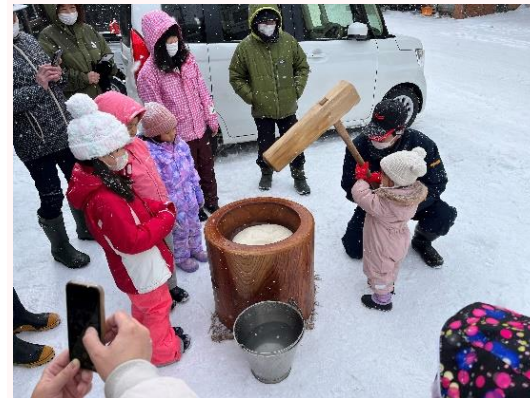
初めての餅つきに挑戦!