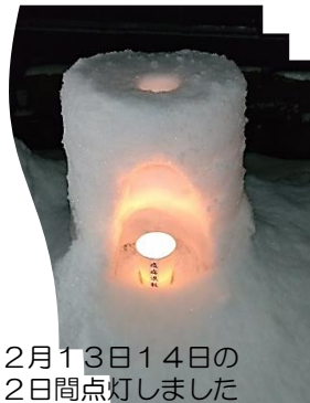
2月13日14日の2日間点灯しました