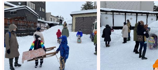
木そりや箱そりも